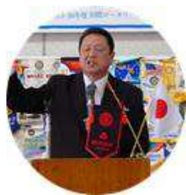
広島県議会議員 下森宏昭 様